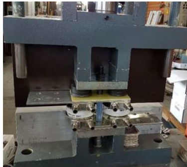
Dioden und Thyristoren